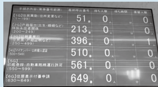
窓口の番号呼出状況がYouTubeで確認できます