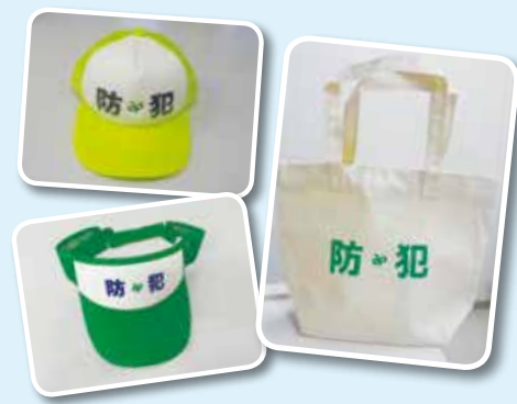
緑区地域振興課くらし安心室 ☎292-8107 ㊟292-8159

対象 区内在住・在勤・在学の18歳以上で、原則週1回以上活動できる方 申込方法 本人確認書類(運転免許証・健康保険証など)を持参の上、緑区役所地域振興課くらし安心室の窓口で、申込書を記入してください。