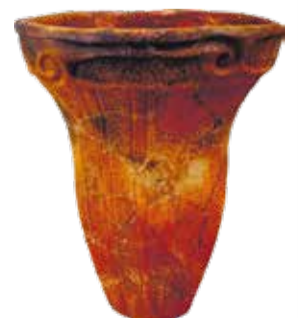
加曽利 E Ⅱ 式土器 I～Ⅳの順に新しくなります

加曽利貝塚の E 地点から出土した土器。実は、考古学者は、時期を表すのに土器の型式を使います。加曽利 E は、関東地方の縄文時代中期後半（約4700年前）を表します。加曽利貝塚から出土したこの土器が独特な形をしていたので、この時期を加曽利 E と呼ぶことになったんですよ。すごいでしょ（えっへん）