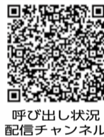
呼び出し状況 配信チャンネル