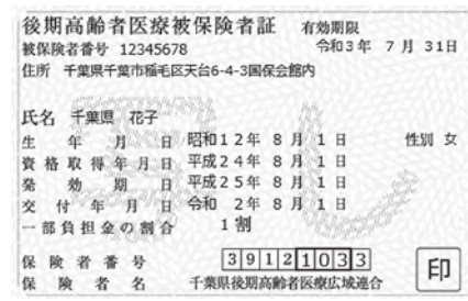
後期高齢者医療制度 の保険証