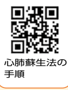
心肺蘇生法の手順

もしもの時、あなたの知識と勇気で救える命があります。日本医師会作成の心肺蘇生法の手順をチェックしましょう。