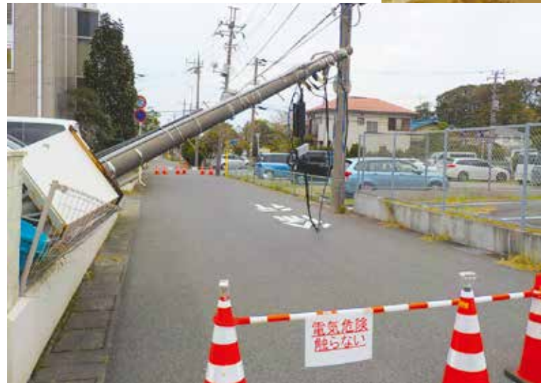
◀東日本台風による電柱の転倒(中央区都町)

1年前、私たちは令和元年房総半島台風(第15号)、東日本台風(第19号)に襲われました。続く10月25日の大雨では、土砂崩れにより尊い命が奪われました。 市では、この経験を教訓として、「災害に強いまちづくり政策パッケージ」を策定しました。感染症への対策が求められる中、いつ起こるかかわからない災害に備え、大切な人を守るために、私たちが今できることを改めて考えてみましょう。 ☎防災対策課 ☎245-5113 ㊟245-5552