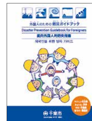
外国人のための防災ガイドブック

避難所となる体育館の酷暑対策のため、全市立学校にスポットクーラーを配備しました。