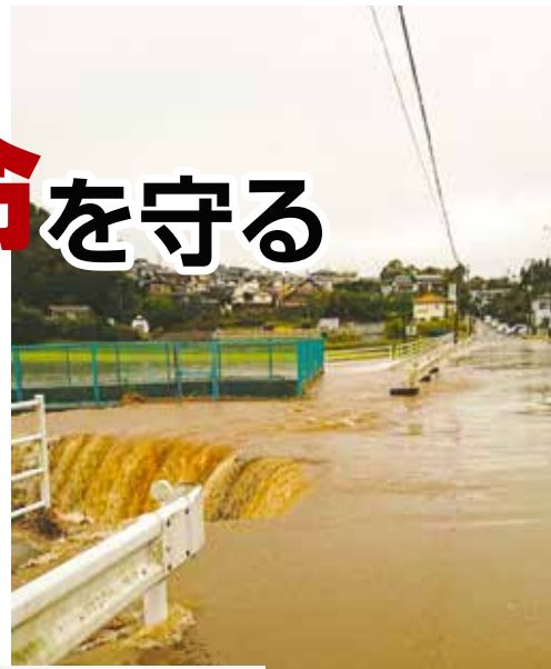
10月25日の大雨による冠水(若葉区川井町)▶