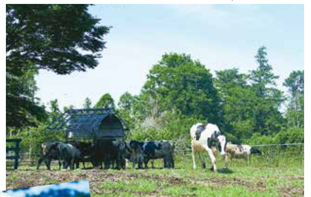
子牛の放牧風景も見られます