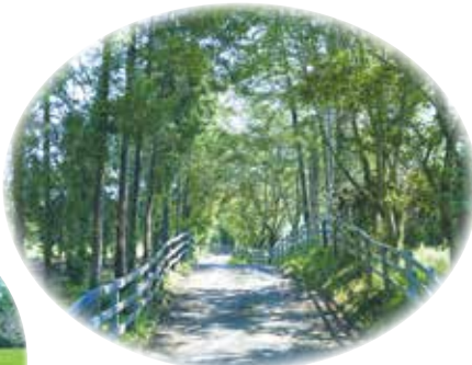
新緑や紅葉の季節に歩いてみたい！