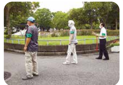
区域全体をくまなくパトロール

現在は、3人1組で毎日夜間にパトロールしています。毎日というと、大変なように思えるかもしれませんが、隊員の数が多いので、半年に1回くらいのローテーションとなり、それほど負担を感じません。パトロールには、外国人の隊員も積極的に参加してくれています。