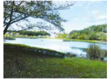
大百池(おおどいけ)