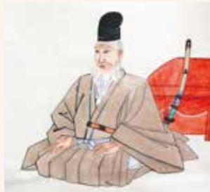
千葉常胤肖像画 (成田山靈光館蔵)

これまで、ほぼ千葉にしか所領を有していなかった千葉一族は、常胤の活躍により、10年足らずで東北から九州に至る全国各地に所領を持つ幕府屈指の有力御家人となったのです。 千葉氏ポータルサイト