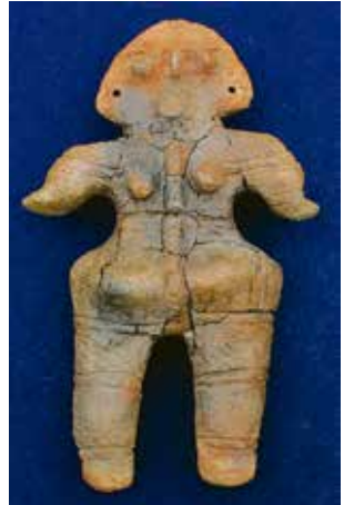
山形土偶(縄文時代後期)

土偶は多くの場合、頭や手足、胴体などがバラバラで見つかります。わざと壊していることが多いみたいなんです。この土偶はほぼ全てのパーツがそろっていて、全体像がわかることはとても珍しいことなんですよ(えっへん)。