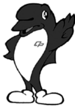
千葉県警察シンボルマスコット シーポック (C-POC)

飲酒運転による悲惨な事故が絶えません! 「飲酒運転を絶対しない、させない、許さない」という強い意志を持ちましょう