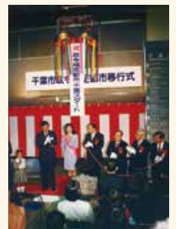
政令指定都市移行式

1980年には広島市が全国で10番目の政令指定を受けることとなり、広島市に次いで人口の多い堺市、千葉市、仙台市の3市が政令市移行に向けて準備を進めていました。千葉市では、1990年に人口が82万人を超え、行政・経済・文化などのデータを見ても先進の政令市移行時の状況と遜色なかったことから、1991年に当時の自治省に要望書を提出、1992年4月1日に政令市に移行しました。