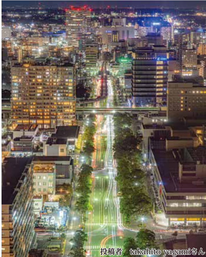
投稿者 takahito yagamiさん