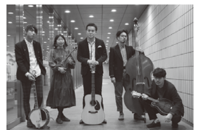
ブルーグラス☆ポリス

申込方法 1月10日(火)から電話で、文化センター☎224-8211、市民会館☎224-2431、市男女共同参画センター☎209-8771、若葉文化ホール☎237-1911、美浜文化ホール☎270-5619(料金は当日精算)。