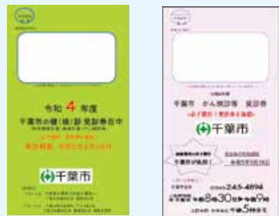
緑またはピンクの封筒で郵送します

検診書類が届かず、職場検診など、ほかに検診の受診機会がない方で、検診を希望される方は、健康支援課へお申し込みください。