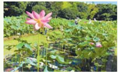
☎花見川区地域振興課地域づくり支援室 ☎275-6203 ☎275-6799