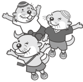
下水道キャラクター (カワウソ一家)

*すでに従量使用料のみで料金適用を受けている方や、基本使用料などの減免(既存の減免制度)を受けている方は対象外です。