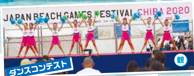
ダンスコンテスト