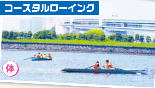
コースタルローイング