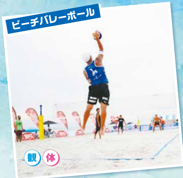
ビーチバレーボール