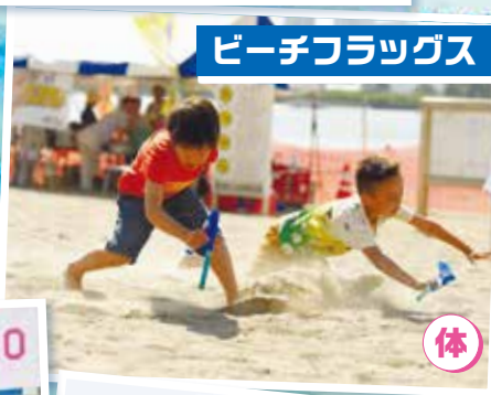
ビーチフラッグス