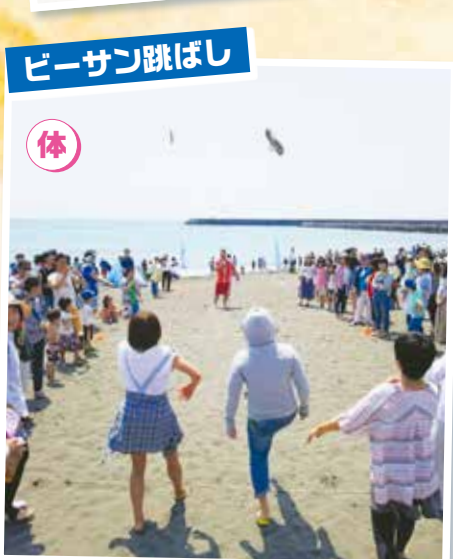
ビーチサン跳ばし