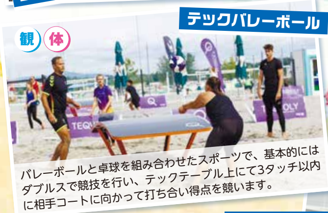
テックバレーボール

味方同士で向き合って、ラケットでゴムボールを打ち合い、ボールを落とさずにラリーを楽しみます。