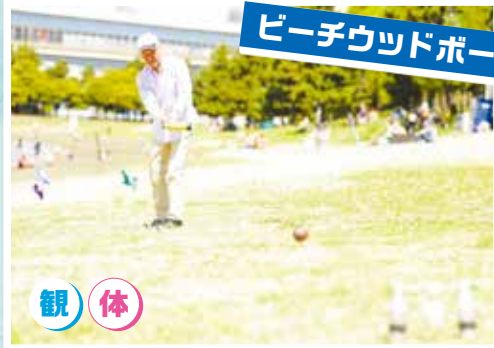
ビーチウッドボール