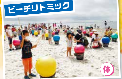
ビーチリトミック