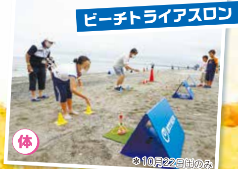
ビーチトライアスロン