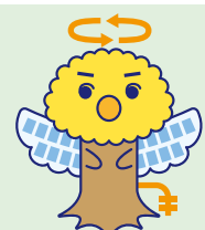
7 省エネエンジェル