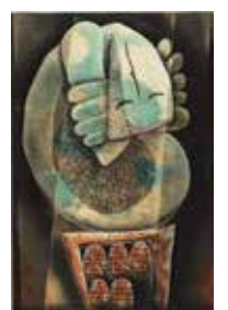
《青春の碑》 深沢幸雄1993年