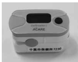
パルスオキシメータ

返却方法 パルスオキシメータに同封の返却用封筒で返却してください。返却用封筒を紛失した方は、〒261-8755千葉県保健所感染症対策課へ郵送するか、直接持参してください。