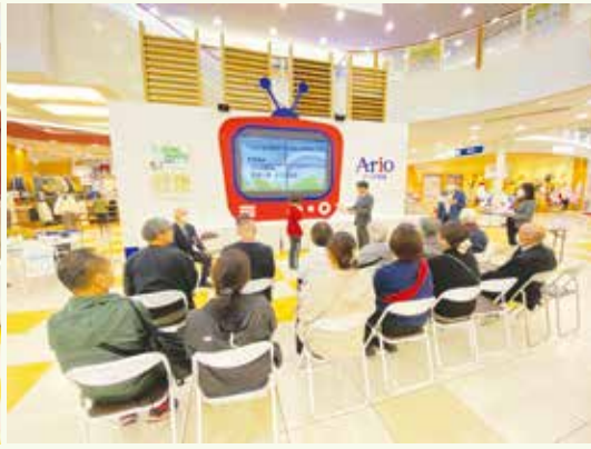
中央保健福祉センター健康課 ☎221-2582 ☎221-2590