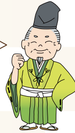
ちばのすけ 千葉介

開館時間は9:00～17:00(入館は16:30まで)、休館日は月曜日(祝日の場合は翌日)・年末年始です。入館料は無料だよ。