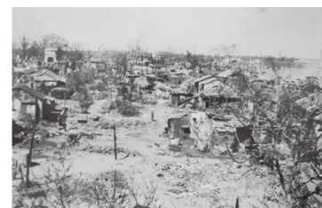
空襲で焼け野原になった院内小学校付近(院内保育園屋上から)

6月10日の空襲では、日立航空機千葉工場(現在の中央区川崎町)などが被害を受け、死傷者391人、被災戸数415戸、被災面積26ヘクタールに及びました。7月7日の空襲(七夕空襲)では、中心市街地の大部分が焼き尽くされ、死傷者1,204人、被災戸数8,489戸、被災面積205ヘクタールに及びました。