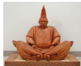
千葉介常胤像 (安西順一作/郷土博物館蔵)