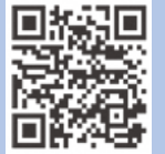
市ワクチン接種 予約サイト