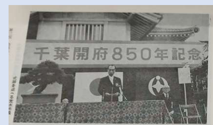
荒木市長による式辞