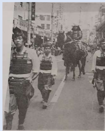
騎馬武者パレード (千葉常重隊)