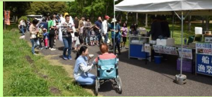
縄文春祭りでの貝料理提供