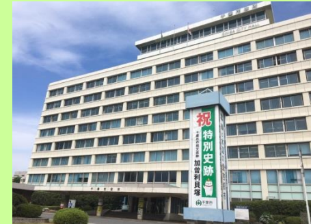
市役所前の懸垂幕