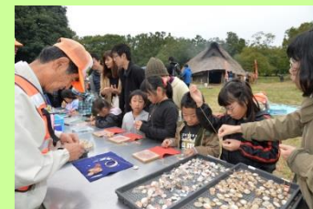
貝のアクセサリづくり体験