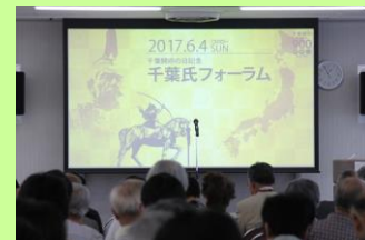
千葉氏フォーラム（6/4） （260人来場）