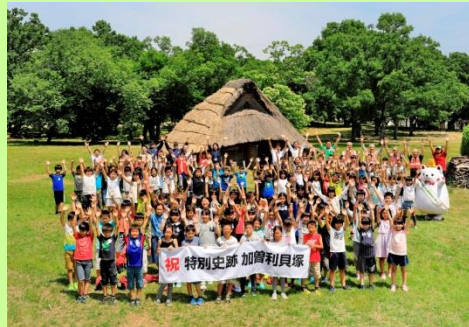
復原住居前に集まった地元の小学生