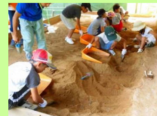
土器ドキ発掘体験