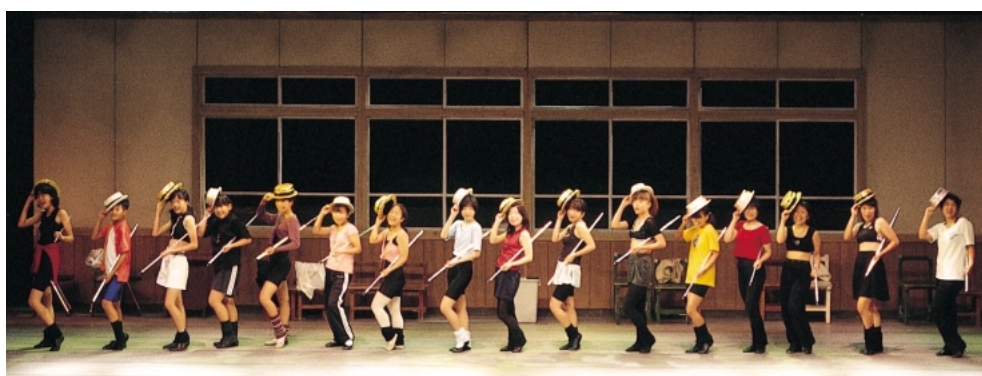
青少年ミュージカル

文化情報ネットワークの整備を進め、市民への最新の文化情報の提供など広報・PR活動の充実と活用を図ります。また、国内他自治体や国際的な文化交流の促進など交流機会の提供を図ります。