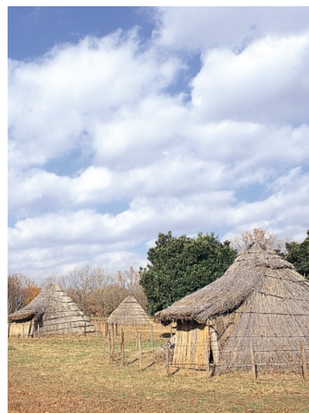
加曽利貝塚復元住居