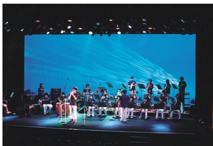
ベイサイドジャズフェスティバル

さらに、行政は、市民の文化活動や交流、そしてネットワークづくりを支援、促進し、人材の育成や活動の場などの条件の整備を進めるとともに、市民、企業、そして教育機関等との協働体制を作り上げるほか、行政自らの文化化のための努力が必要です。