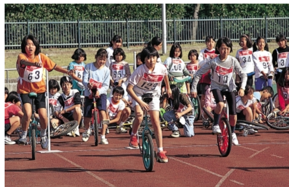
スポーツレクリエーション大会

市民の健康・体力づくりや競技力向上のため、体力測定・トレーニング指導を実施するとともに、スポーツ相談窓口の充実に努めます。また、より効果的な医科学的スポーツ指導方法の提供と啓発を推進します。