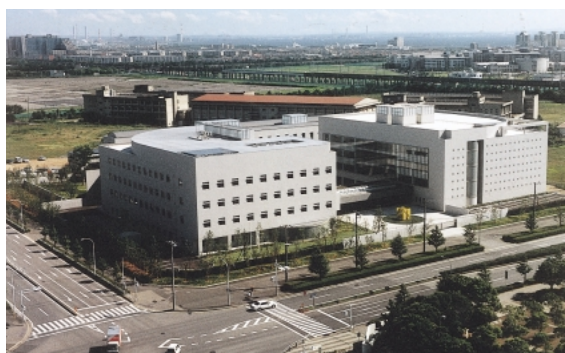
日本貿易振興会アジア経済研究所