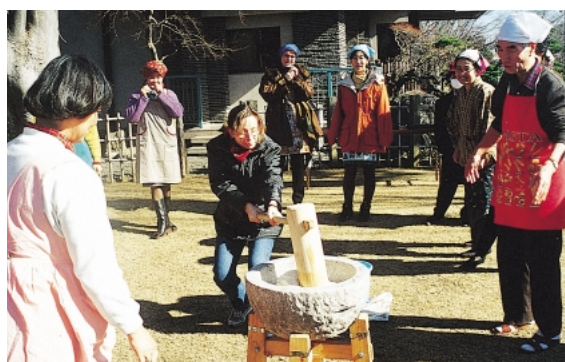
餅つき大会（国際交流グリーンハウス）

そのためには、世界に通用する文化を提供し、創造する場など、人、もの、情報が交流する国際活動の拠点づくりやネットワークの強化が求められます。