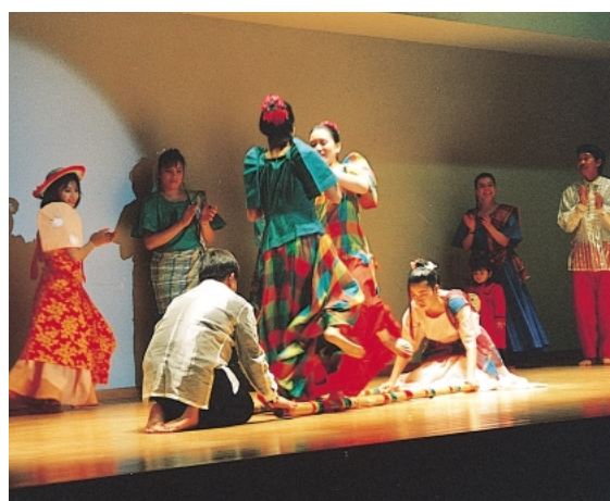
国際ふれあいフェスティバル

本市の立地特性を活かし、人、もの、情報等が交流する国際活動の拠点づくりを進めるとともに、これら拠点のネットワークの強化を図ります。