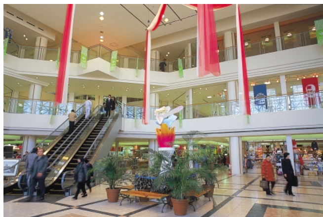
幕張新都心の複合店舗

雇用の促進や勤労者が安心して働ける環境を整えるため、勤労者施策の一層の充実を図ります。