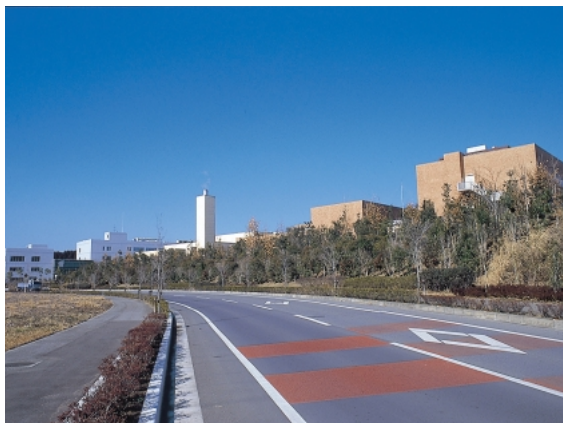
千葉土気緑の森工業団地

さらに、都市の活力を維持・向上させていくため、先端技術産業や地元雇用力の大きい成長産業の誘致に努めるとともに、工業団地の整備について検討を行い、次代を担う産業の集積を図ります。