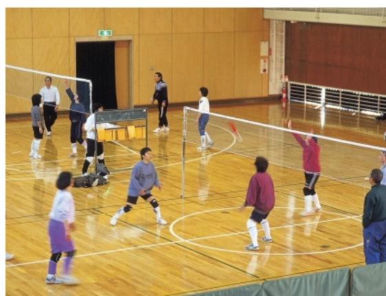
長沼原勤労市民プラザ

さらに、高齢者・女性・障害者の雇用機会の確保等の支援をするほか、勤労者の活動拠点となる施設を整備します。