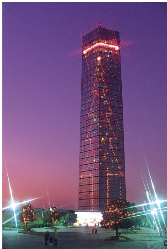
千葉ポートタワー

また、千葉ポートタワーを魅力ある観光施設の拠点とするため、施設の充実や周辺環境整備を促進するほか、滞在型観光施設としてユースホステルを近代的な施設として整備するとともに、多様な野外活動の高まりに対応する屋外施設を整備し、緑豊かな自然に囲まれたレクリエーション地域の形成を図ります。