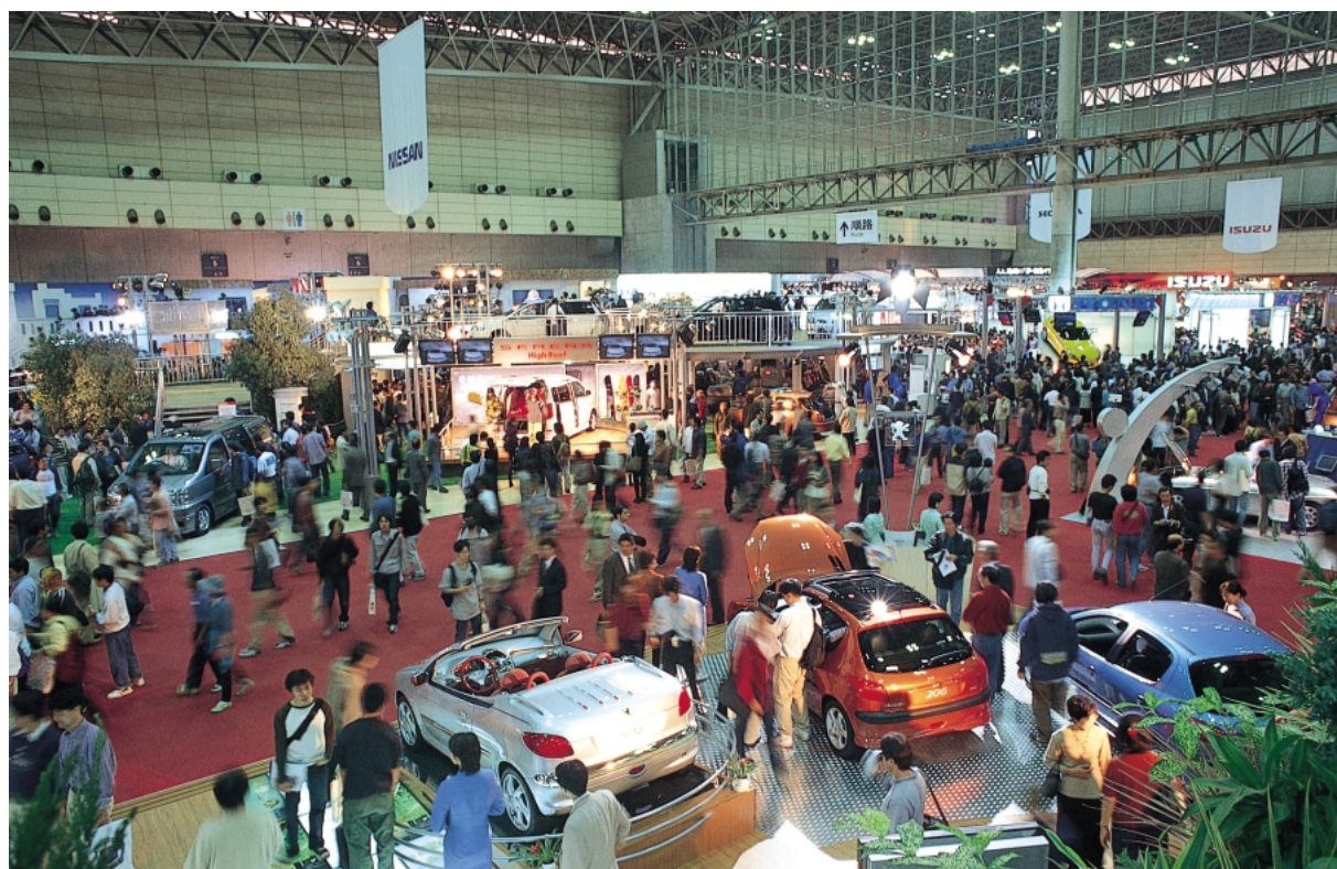
東京モーターショー（幕張メッセ）

また、コンベンションの開催情報の広報に努め、来場者の増加を図り、地域のコンベンション関連産業を振興します。