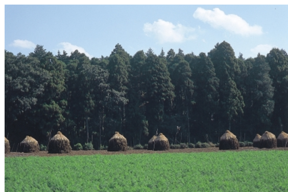
にんじん畑・落花生畑