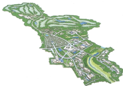
ちばりサーチパーク（完成予想図）

本市の活力の維持発展のため、工業の国際競争が激化する中、既存工業集積地の立地環境の整備を促進し、立地企業の高度化を図ります。