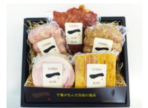
大賞のチグサミートソーセージ&ハム