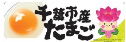
千葉市産たまごパッケージ

千葉市ギフトセレクション2016大賞受賞のソーセージ&ハム(チグサミート)、同セレクション一般投票特別賞の「和三盆プリン」(菓子工房セラヴィ)などの商品を含む市内土産品を用意。