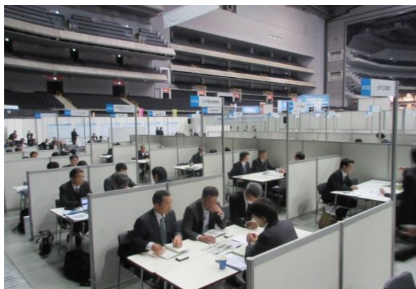
《昨年度商談風景より》

取引先の新規開拓のきっかけづくりや、新たなビジネスチャンス創出の機会として、埼玉県、千葉県、東京都、神奈川県、横浜市、川崎市、千葉市、さいたま市、相模原市の9都県市による合同商談会を開催いたします。