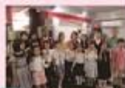
オペラ公演後の記念写真