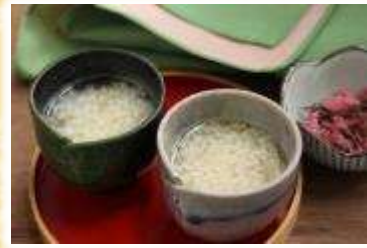
No.3 国産米甘酒 (糀やます・加曽利房の駅)