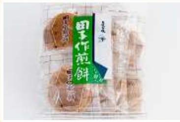
No.5 田子作煎餅 (有)田子作本舗本店