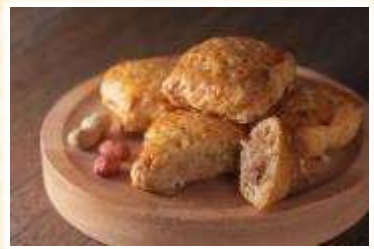
No.7 落花生パイ (株)オランダ家

以下に必要事項を記入のうえ、そごう千葉店に設置の投票箱に投票してください。 10月21日(土)、22日(日) 10:00~