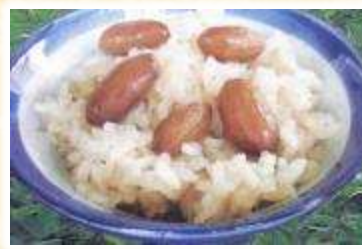
No.6 落花生ごはんの素 (株)はせべ・豆処はせべ