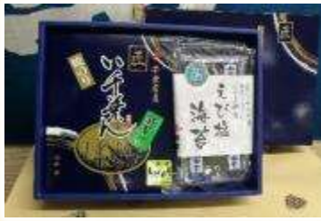
No.1 い千葉県海苔詰合せ (えび塩海苔と焼のり) (有)鮎澤