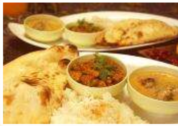
No.2 印度料理シタール インドカレーギフトセット (有)シタール・印度料理シタール