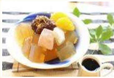
No.4 蕎麦屋のスイーツ 蕎麦甘 (手打ち蕎麦 貴匠庵)