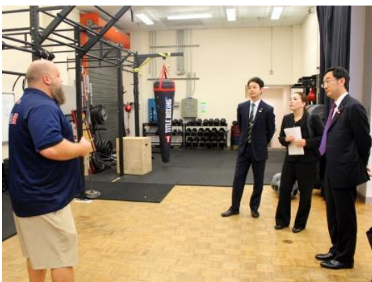
フィットネスルーム