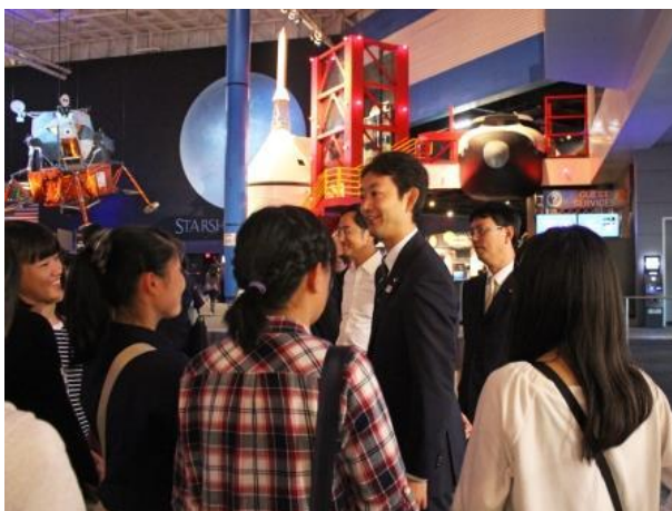
ホームステイ中の稲毛高校生徒との対面