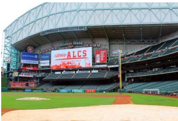
ミニッツ・メイド・パーク