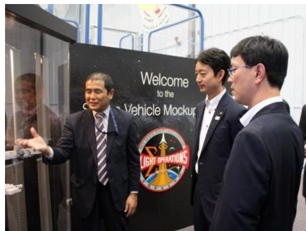
JAXA の説明を受ける訪問団