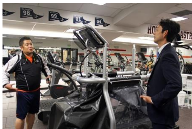
選手のリハビリルーム