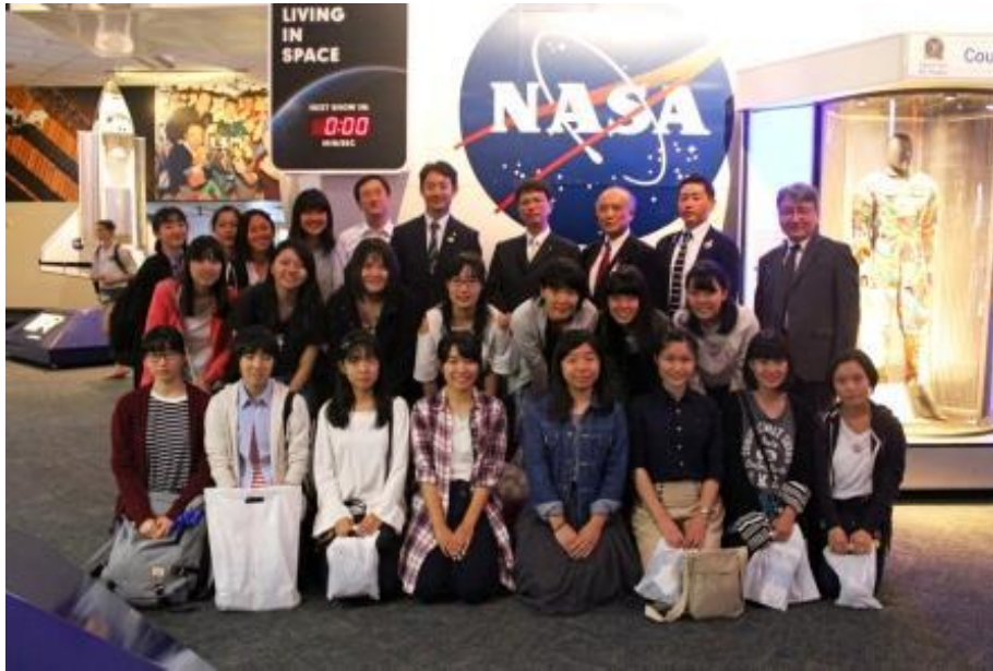
稲毛高校の生徒たちと