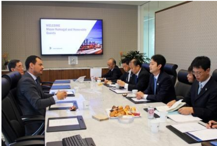
GHP との意見交換の様子

GHPは、1989年にヒューストン商工会議所、ヒューストン経済開発評議会、及びヒューストン世界貿易協会が合併して設立されたヒューストン地域の経済団体である。