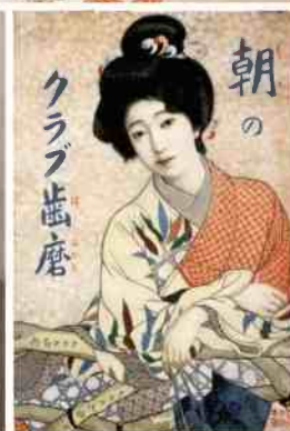
1《種か》大正4年(1915) 滋賀県立近代美術館 前期展示 / 2《鏡の前》大正4年(1915) 滋賀県立近代美術館 前期展示 / 3《願いの糸》大正3年(1914) 公益財団法人木下美術館蔵 全期間展示 / 4《墨染》大正後期 川浦真樹氏蔵 全期間展示 / 5《淀君》大正9年(1920) 耕三寺博物館蔵 全期間展示 / 6《いとさんいさん》昭和11年(1936) 京都市美術館蔵 後期展示 / 7《ポスター-朝のクラブ歯磨》大正2年(1913) 公益財団法人吉田秀雄記念事業財団 アド・ミュージアム東京蔵 全期間展示 ※会期中、一部展示替を行います。前期:11月3日~11月26日 後期:11月28日~12月17日