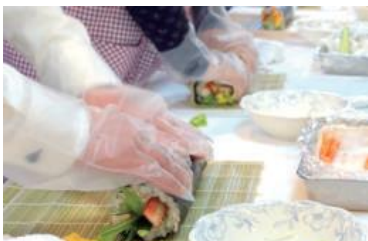
メイプルイン幕張「太巻き寿司作り体験」