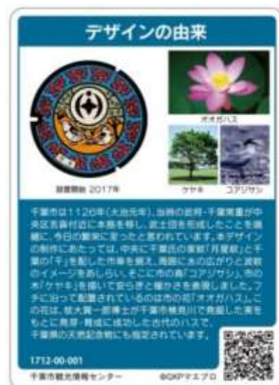
マンホールカード（裏）