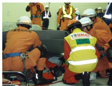
国民保護実動訓練の様子(平成19年)