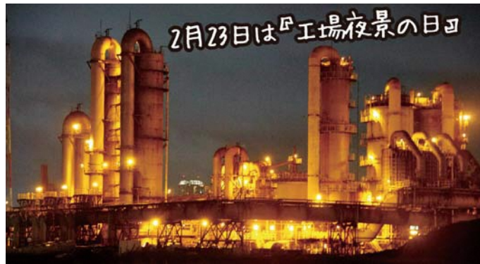
2月23日は「工場夜景の日」

ダイヤモンド富士が観賞できる期間にあわせて特別運行が決定! 琥珀色の工場夜景に加えてダイヤモンド富士が見られるチャンス! シーフードレストラン「ピアゼロワン」でアツアツのクラムチャウダーも♪