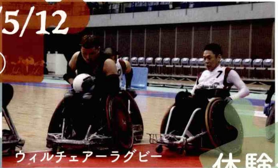
ウィルチェアーラグビー