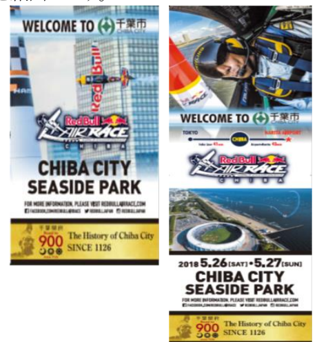
海浜幕張駅周辺バナー