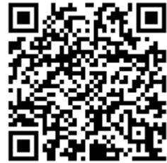
Catalog Pocket の QR コード

【URL】 https://www.catapoke.com/viewer/?open=6ff99