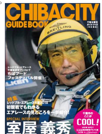
CHIBA CITY GUIDE BOOK