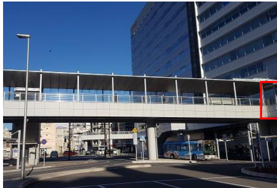
千葉駅西口デッキ（設置前）