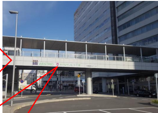
千葉駅西口デッキ（設置後）