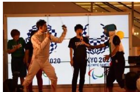
ステージイベント（イメージ）