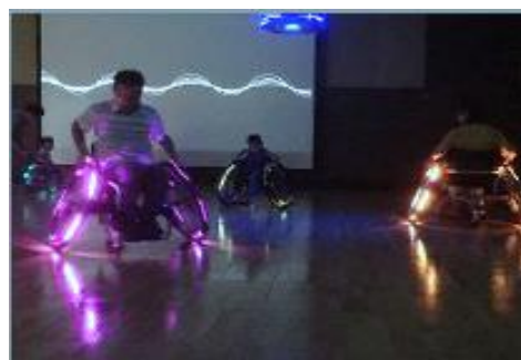
PLAY THE WHEELS