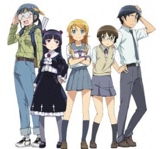
「俺の妹がこんなに可愛いわけがない」

また、千葉都市モノレールでは、過去にラッピング車両の運行やコラボグッズの販売を実施したところ、徹夜組が現れ即日完売するなど好評を博した。