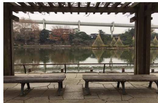
アニメ第1期第3話で主人公京介と麻奈美が2人で休日を過ごした千葉公園（左）、千葉公園の実写（右）