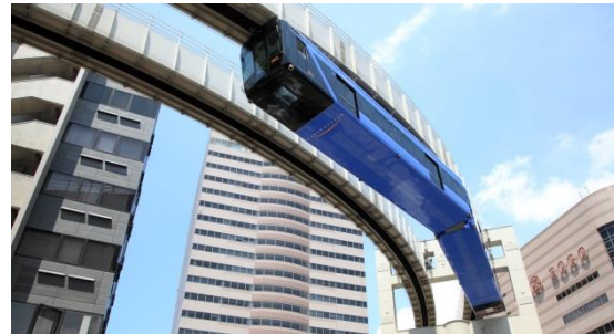
作中のそごう千葉店（作中では”SOSO”と表記）とモノレール（左）、そごう千葉店前の実写（右）