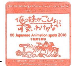
公式ご朱印 (約 8cm × 8cm)