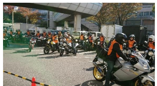
昨年度の出発式の様子