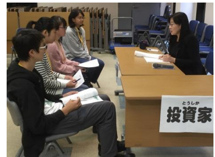
プレゼンにより事業資金獲得