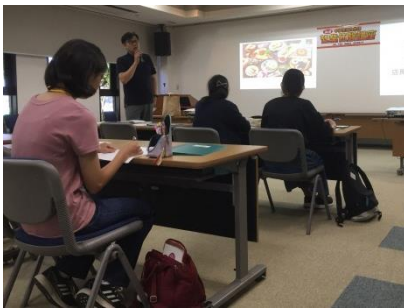
本物の経営者による講話