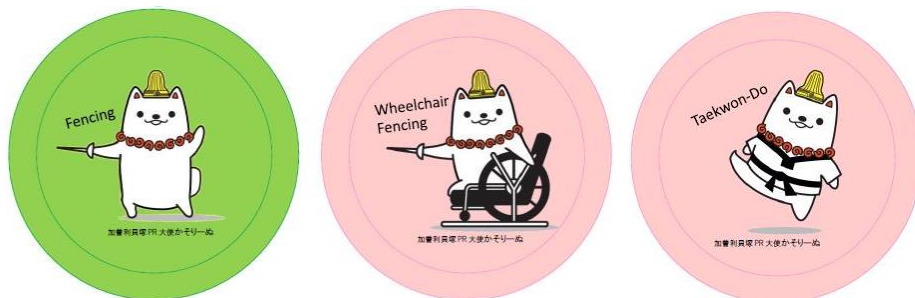
缶バッジイラスト（左から、フェンシング、車いすフェンシング、テコンドー）