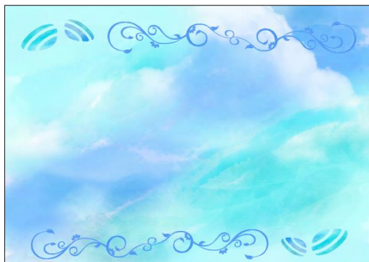
「あい染め」デザイン